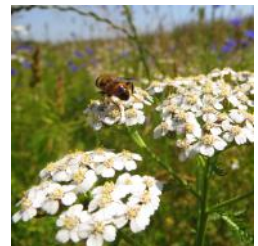
Wildbiene auf Schafgarbe