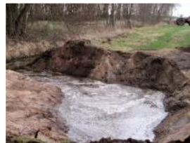
Anlage einer Grabentasche ▷